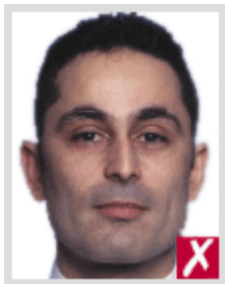
โก่งเกินไป