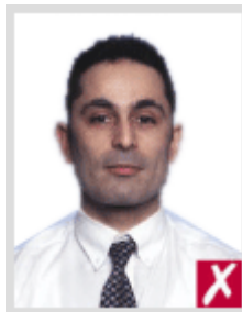
โก่งเกินไป